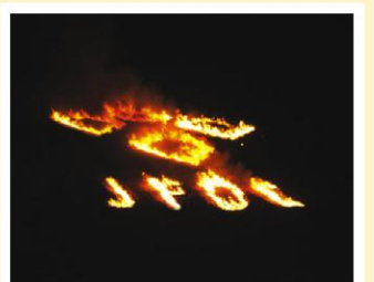
2011年腾格里沙漠拓展