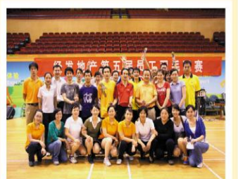
2009年第五届羽毛球赛