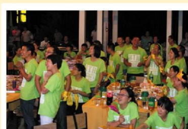
2012年公司八周年庆典