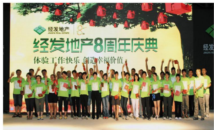
“磐石奖”员工合影留念