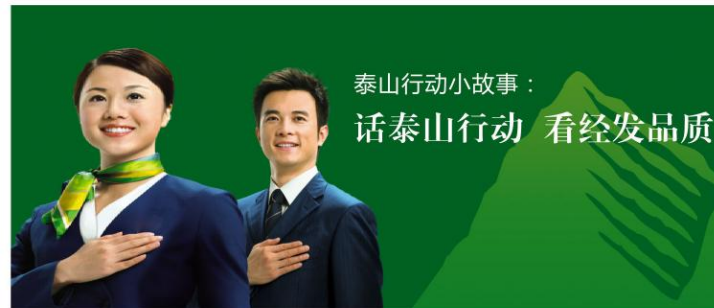
泰山行动小故事： 话泰山行动 看经发品质

“质量管理”是企业生存和发展的永恒主题，而唯有使体系不断的通过“评审——运行——评审”进行完善和提高，才能保持质量管理体系长久、活跃的生命力。此次管理评审真实、客观的反馈了经发地产体系运行的实际情况，切实解决并落实了运行中发现的问题，在持续改进并勇于创新的机制保证下，更好的提升各项管理工作水平。