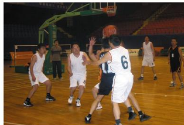
2004年第一届篮球比赛