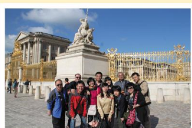
2012年经发之星欧洲游