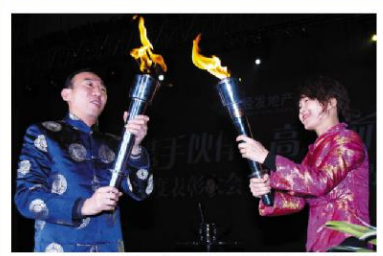
2007年春节联欢会火炬传递