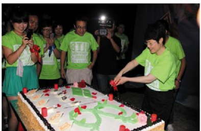
分享经发地产八周岁生日蛋糕

作为带领经发地产一路走来的领路人，韩总用一场精彩的演讲表达了自己的感想。韩总在演讲中总结了经发地产八年来积淀的最核心竞争力——始终站