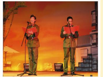
2005年第一届春节联欢会